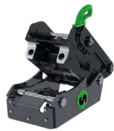
SQ Helautomatiska fästessystem