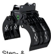
Sten- & sorteringsgrip