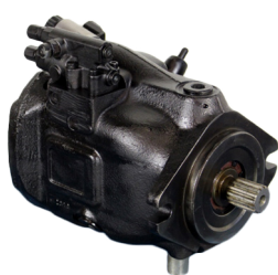
Pump P1, L120F

I vårt sortiment har vi ytterligare ett prisvärt alternativ i form av renoverade reservdelar till mycket konkurrenskraftiga priser. Vi renoverar transmissioner, hydraulpumpar, bromsok, axlar och hydraulcylindrar i egen regi. På dessa komponenter erbjuder vi 1 års garanti och de säljs i ett bytessystem, dvs ni lämnar in er gamla del i pant.