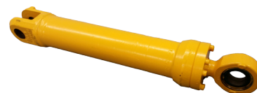
Styr cylinder, L180F