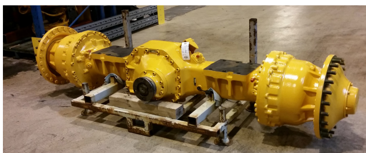
Framaxel, L180E (en renoverad komponent)