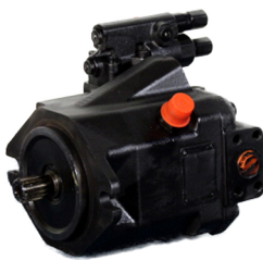
Pump P3, L190E