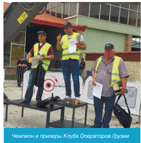
Чемпион и призеры Клуба Операторов Грузии

Соревнования прошли в дружественной атмосфере, зрители, операторы и гости компании Elite Motors могли также принять участие в тест-драйве строительной техники, посмотреть демонстрационное шоу навесного оборудования и опробовать в действии обучающие симуляторы. Для самых маленьких зрителей и бо-