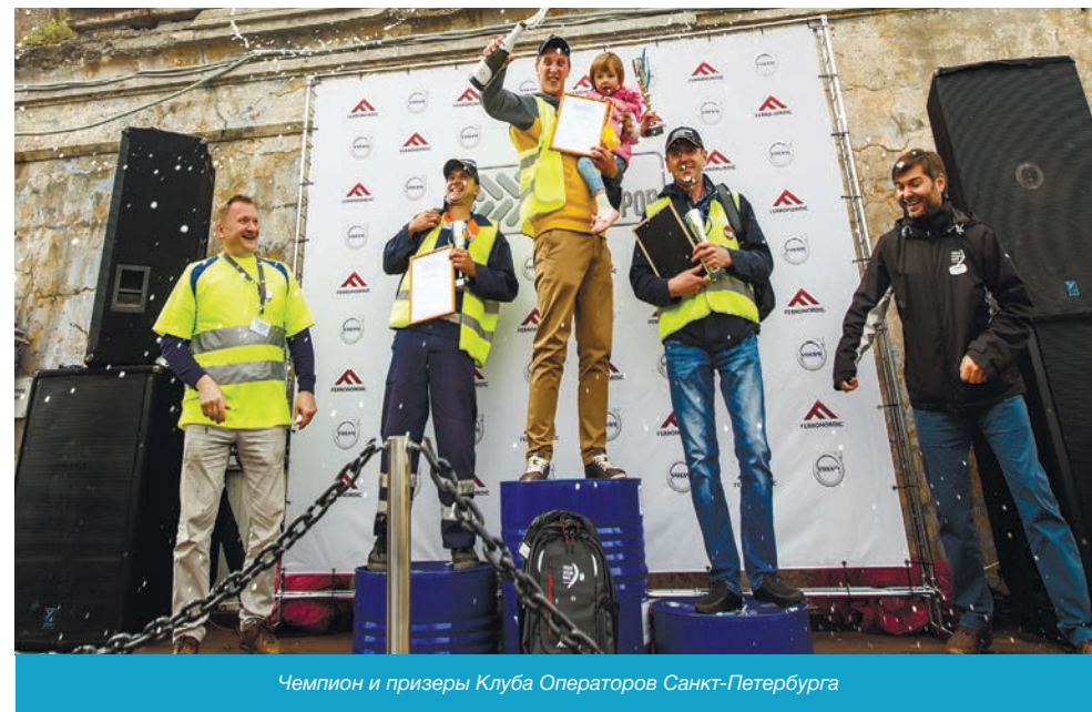
Чемпион и призеры Клуба Операторов Санкт-Петербурга

рожно-строительной техники на территории ВДНХ.