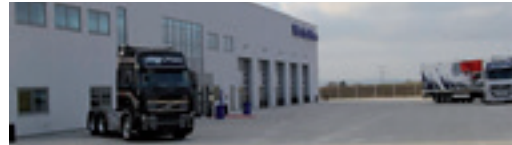
Volvo Truck Center A/S Logistikparken 14, 8220 Brabrand NB! Kun udlevering.