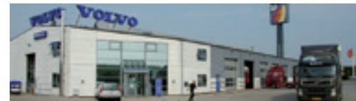
Titan Lastvogne A/S Motelvej 4, Solrød, 2690 Karlslunde NB! Kun udlevering.