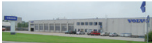
Titan Lastvogne A/S Bødkervej 12, 4300 Holbæk NB! Kun udlevering.