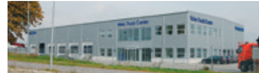
Volvo Truck Center A/S Lokesvej 1, 3400 Hillerød NB! Kun udlevering.