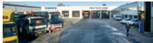
Volvo Truck Center A/S Taastrupgårdsvej 32, 2630 Taastrup NB! Kun udlevering.