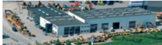
Volvo Entreprenørmaskiner A/S Amerikavej 2, Taulov, 7000 Fredericia, Tlf. 70 22 27