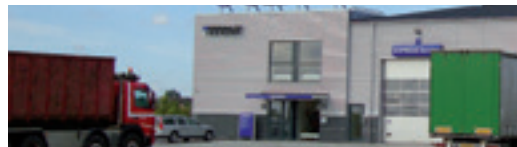
Titan Lastvogne A/S Cargovej 1, 4840 Nr. Alslev NB! Kun udlevering.