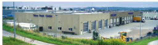
Volvo Truck Center A/S Skjernvej 6, 9220 Aalborg Ø. NB! Kun udlevering.