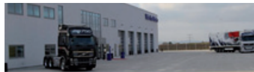
Volvo Truck Center A/S Logistikparken 14, 8220 Brabrand NB! Kun udlevering.