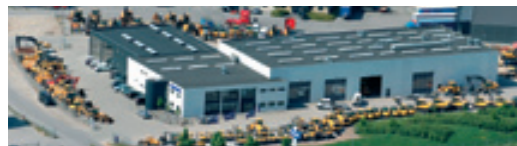
Volvo Entreprenørmaskiner A/S Amerikavej 2, Taulov, 7000 Fredericia, Tlf. 70 22 27