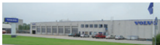
Titan Lastvogne A/S Bødkervej 12, 4300 Holbæk NB! Kun udlevering.