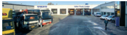
Volvo Truck Center A/S Taastrupgårdsvej 32, 2630 Taastrup NB! Kun udlevering.