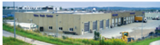
Volvo Truck Center A/S Skjernvej 6, 9220 Aalborg Ø. NB! Kun udlevering.