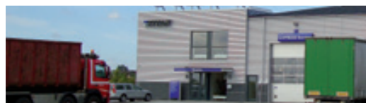
Titan Lastvogne A/S Cargovej 1, 4840 Nr. Alslev NB! Kun udlevering.