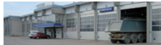
Titan Lastvogne A/S Tranevej 2, 4100 Ringsted NB! Kun udlevering.