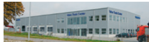
Volvo Truck Center A/S Lokesvej 1, 3400 Hillerød NB! Kun udlevering.