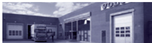
Skifter Lastbil A/S Lillelundvej 22, 7400 Herning NB! Kun udlevering.