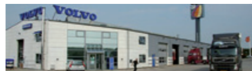
Titan Lastvogne A/S Motelvej 4, Solrød, 2690 Karlslunde NB! Kun udlevering.