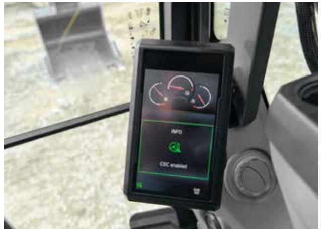
Sterzo a leva Comfort Drive Control