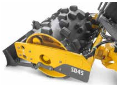
Kit bandage pieds de mouton à boulonner