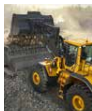
Volvo Construction Equipment