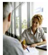
Volvo Financial Services