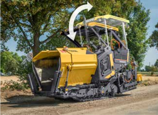
Elhydrauliskt vikbart tak