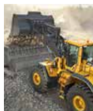
Volvo Construction Equipment