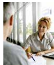
Volvo Financial Services