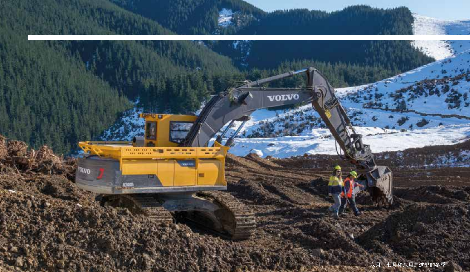
六月、七月和八月是这里的冬季

业。“它可以采伐、加工、装载、树桩采伐、掘沟、种植和铺路，” Keately 说道。