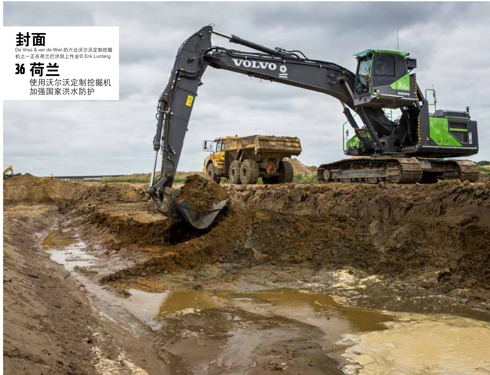
封面 De Vries & van de Wiel 的六台沃尔沃定制挖掘机之一正在荷兰洪坝上作业 36 荷兰 使用沃尔沃定制挖掘机加强国家洪水防护