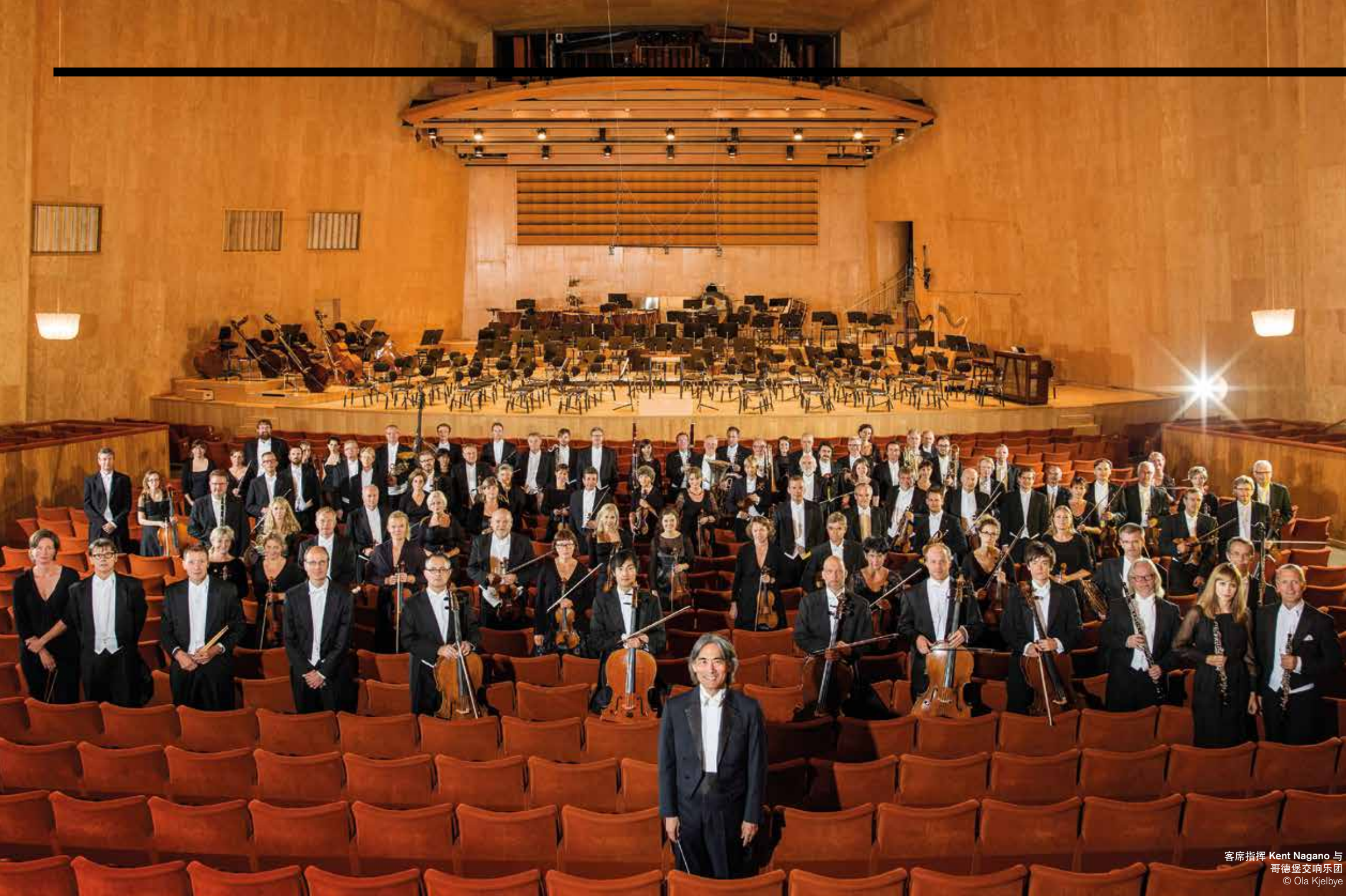
客席指挥 Kent Nagano 与 哥德堡交响乐团