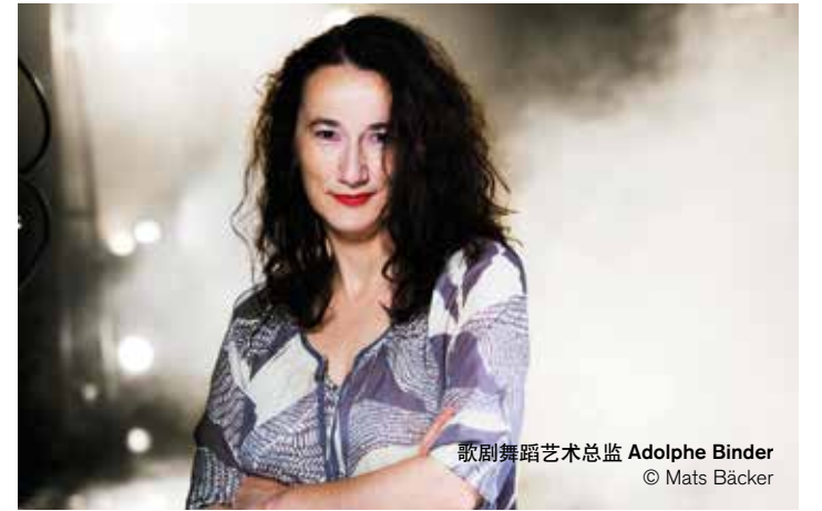
歌剧舞蹈艺术总监 Adolphe Binder