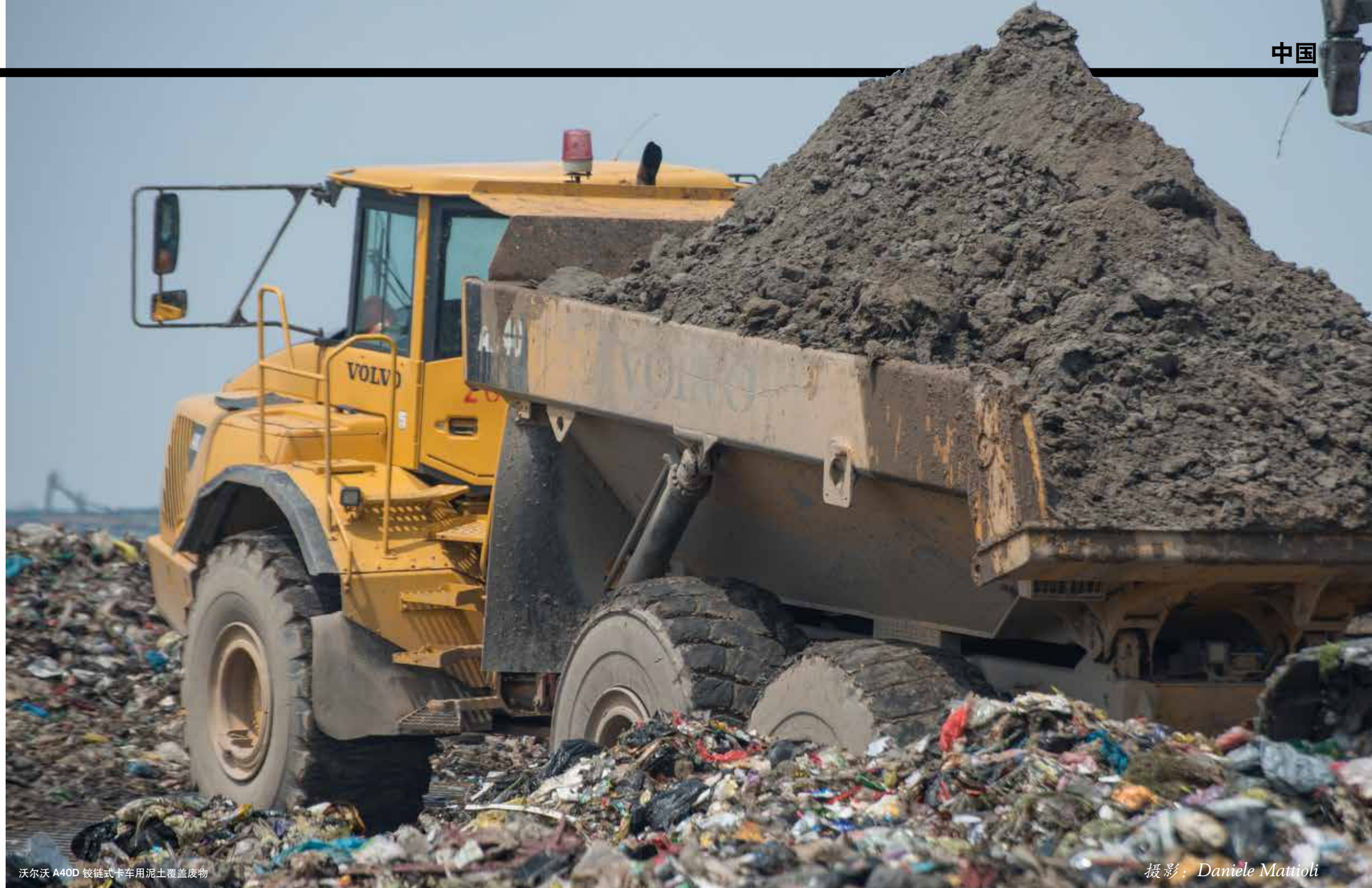
沃尔沃 A40D 铰链式卡车用泥土覆盖废物