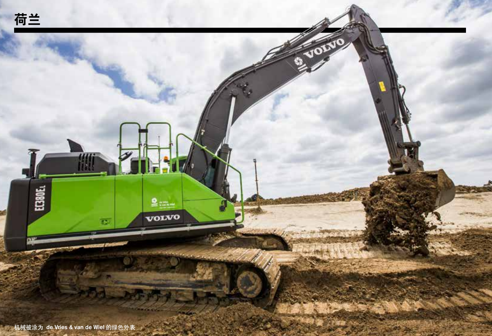
机械被涂为 de Vries & van de Wiel 的绿色外表