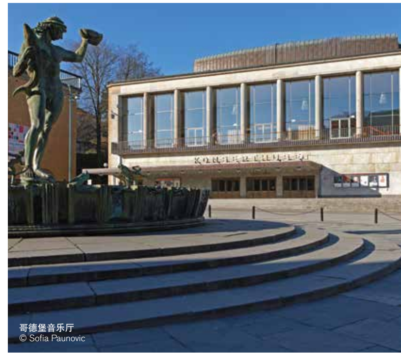
哥德堡音乐厅 © Sofia Paunovic