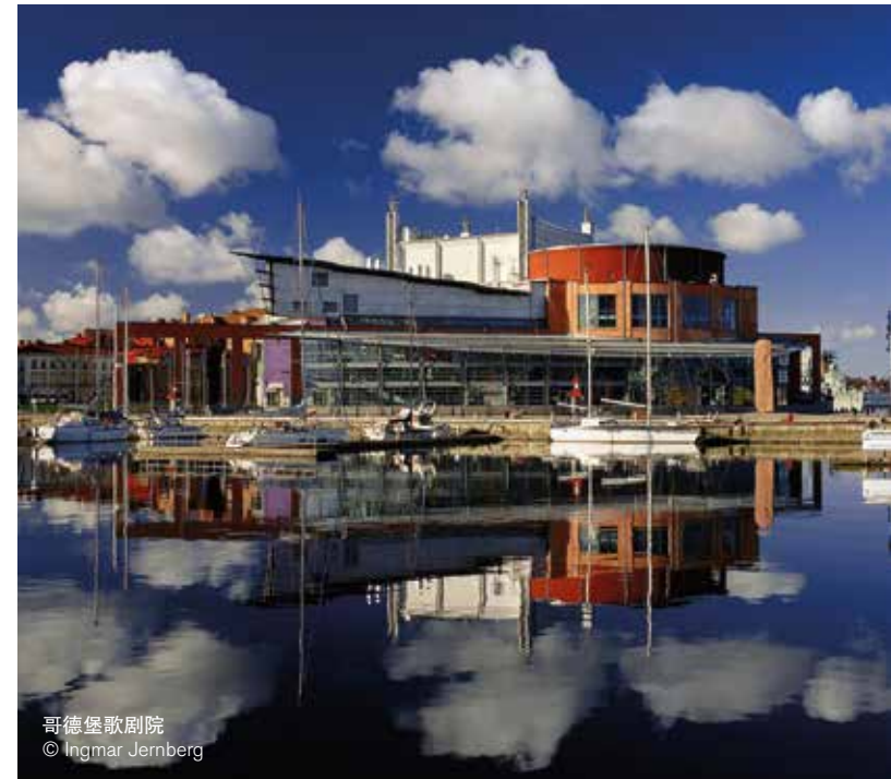
哥德堡歌剧院