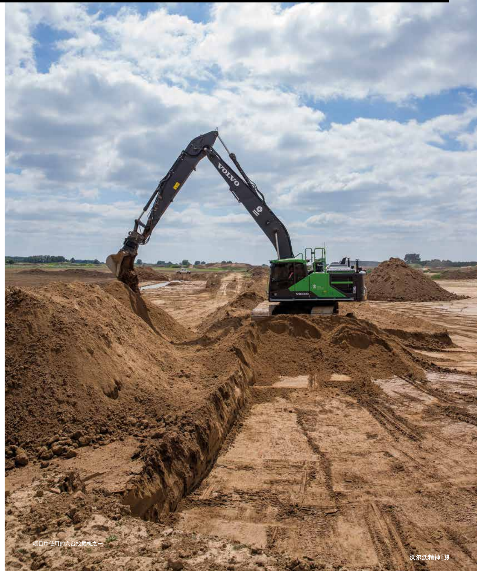
项目中使用的六台挖掘机之一

项目使用六台沃尔沃挖掘机施工——两台 EC380EL、两台 EC250CL 以及两台 EC220DL 机械，这些机械由沃尔沃经销商 Kuiken NV 为 de Vries & van de Wiel 专门定制。