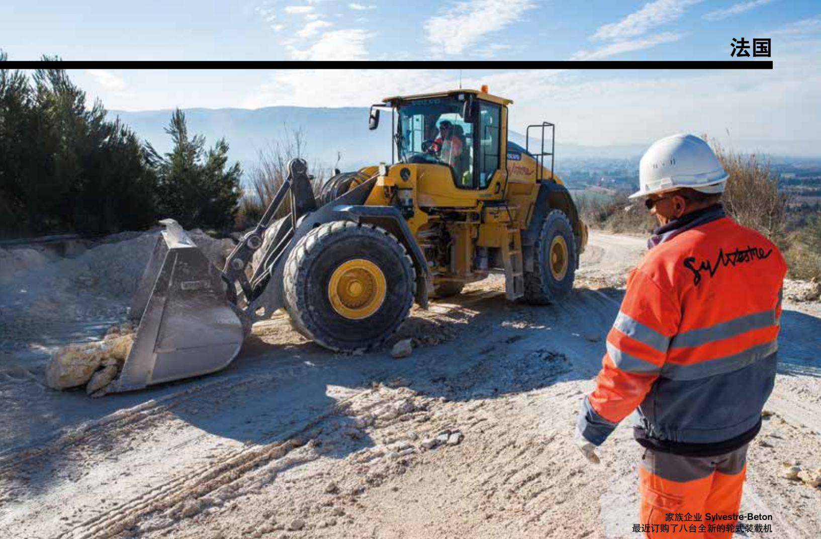
家族企业 Sylvestre-Beton 最近订购了八台全新的轮式装载机