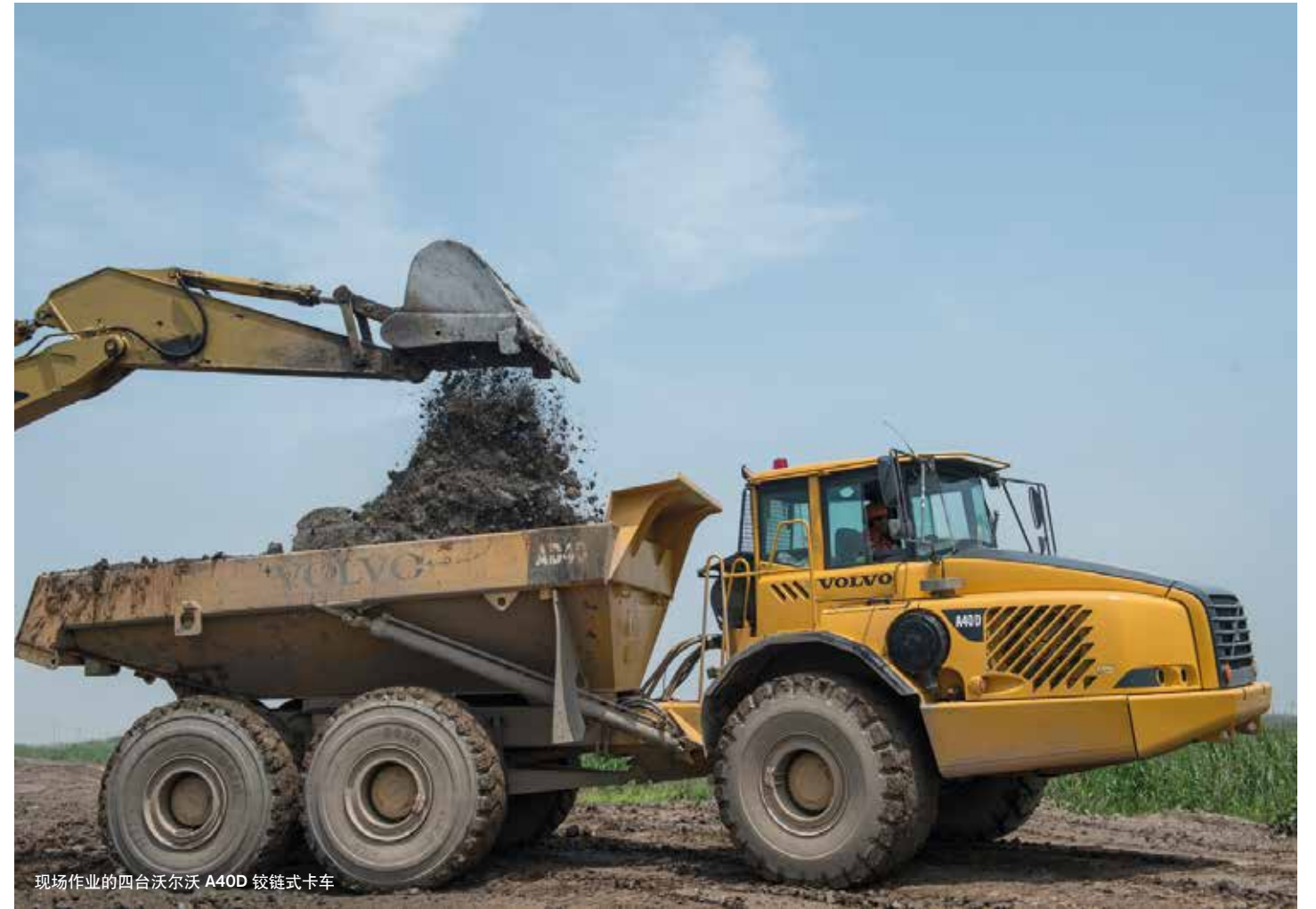
现场作业的四台沃尔沃 A40D 铰链式卡车

出的泥土覆盖了之前的土层，然后再被盖上新的土层和土工膜。土工膜是一种用于收集废物和废物沥出物的非渗透膜。这里的交通量令人震惊，每30秒，就会有一辆亮黄色的集装箱大小的卡车满载到达，然后空车离开。