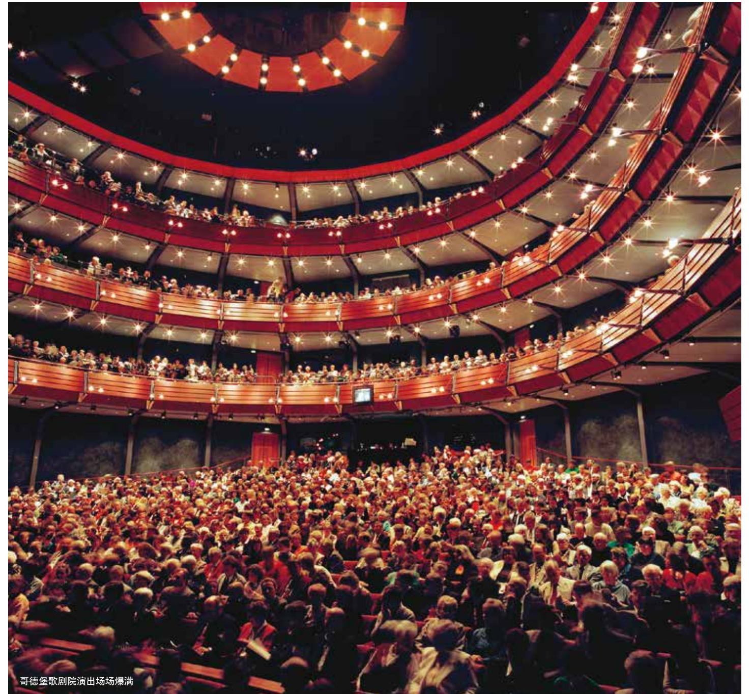
哥德堡歌剧院演出场爆满