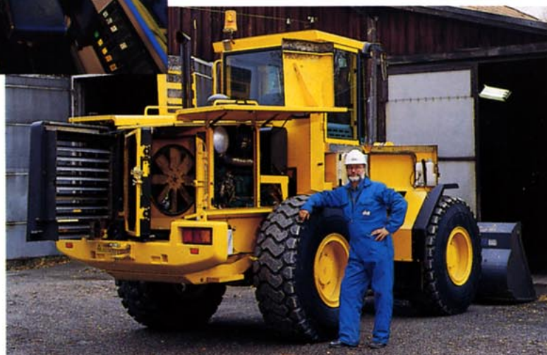
Vi förbehåller oss rätten till ändringar i specifikation och utförande utan särskilt meddelande. Bilderna visar ej alltid maskinen i standardutförande.

Det elektroniska övervakningssystemet Contronic bidrar aktivt till att minska underhållskostnaderna, genom att ständigt hålla föraren informerad om maskinens kondition. En femspråkig display ger löpande besked i klartext vilken service maskinen behöver. Contronic minskar därmed risken för oplanerade servicestillstånd och förlänger maskinens livslängd. Stora, gasfjädrade luckor och utsvängbar kylare förenklar servicen.