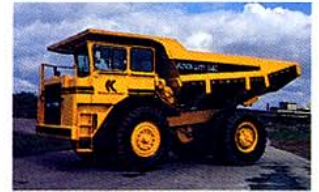
Kockum 540 RB

Den gummikorg, Kockum Landsverk erbjuder som alternativ till bergkorgen på modell K540, har utvecklats i samarbete med Skega AB, ett företag med grövre industrigummi som specialitet. Skega har sedan slutet av 60-talet tillverkat gummi för inklädnad av stålkorgar. Detta slitlager av vulkaniserat gummi ger korgen avsevärt ökad livslängd och lägre ljudnivå vid lastning och lossning. Det är emellertid dyrt att installera och stjäla såväl korgvolym som lastkapacitet.