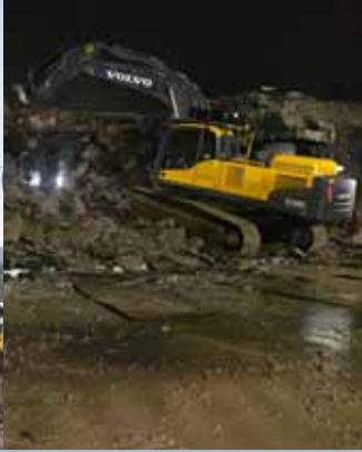
• Stabilité sur les terrains.