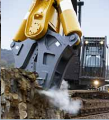
• Forces d'arrachement élevées.