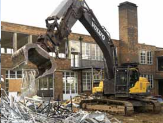
• Systèmes hydrauliques harmonisés.