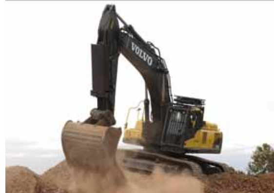
• Stabilité pour le compactage de débris.