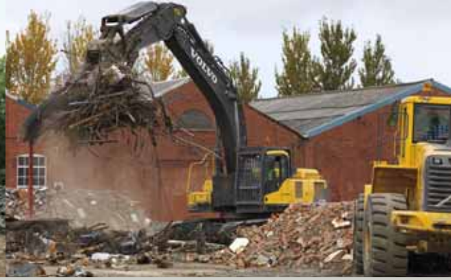
• Pelles hydrauliques, chargeuses sur pneus, etc.