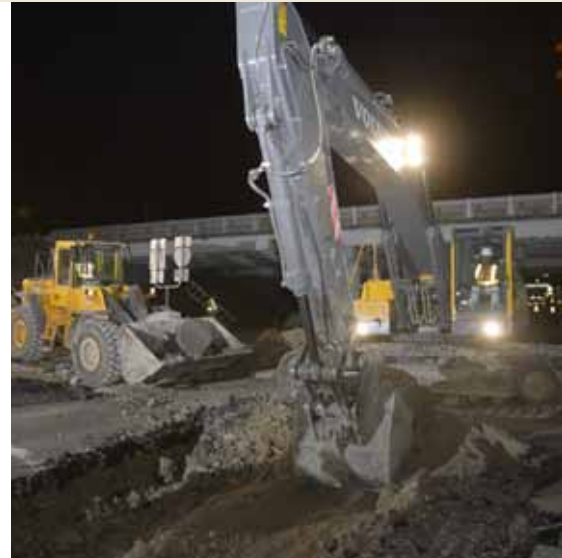
• Performances pour la conversion de sites.