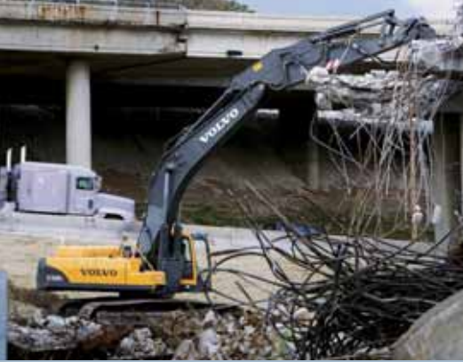
• Volvo vous offre longue portée et accessoires.