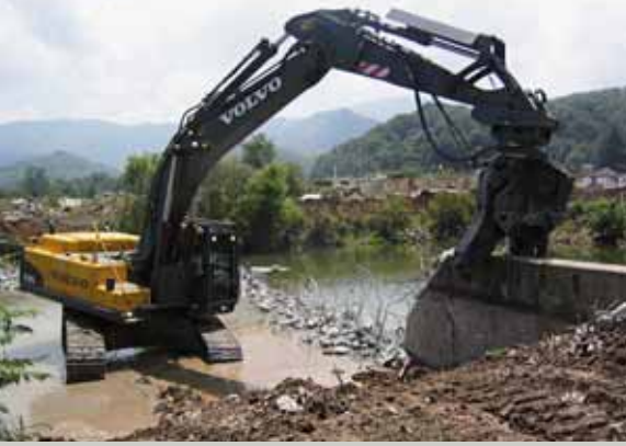
• Puissance, cycles rapides de démolition.