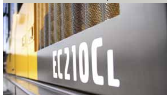
• Des écrans à micromillage empêchent les particules de pénétrer dans les radiateurs.