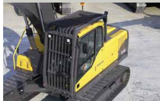
• Protection contre les chutes d'objets (FOG).