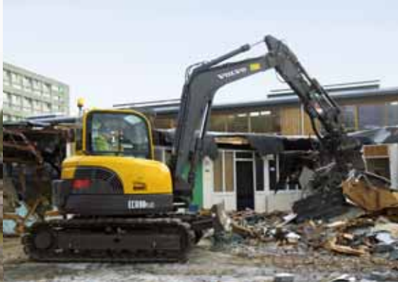
• Volvo propose des solutions complètes.