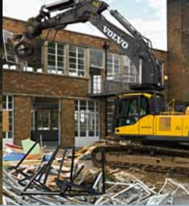
• Maîtrise du travail.