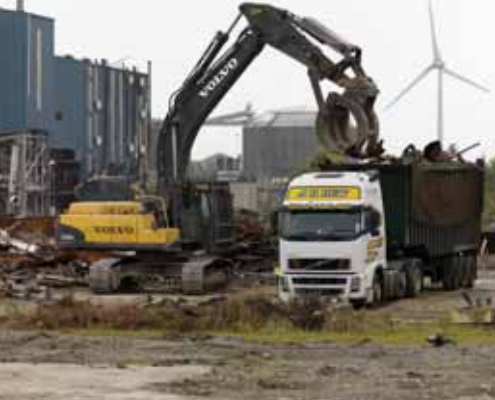
• Cycles rapides de prise et de chargement.