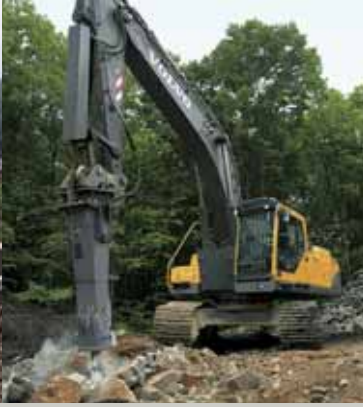
• Performances des accessoires.