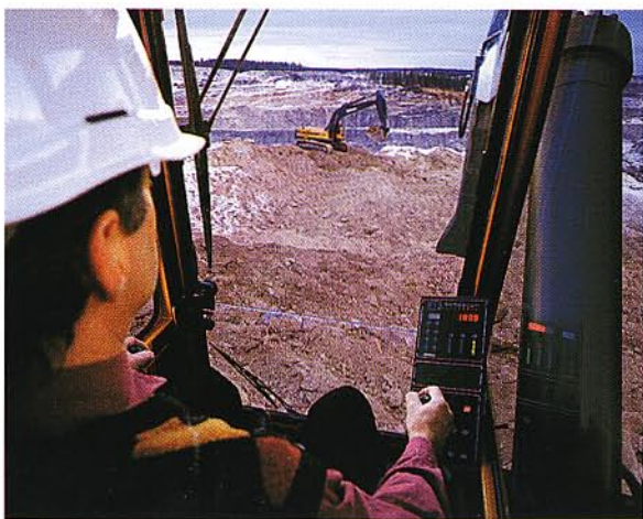
Tungt arbete ska gå lätt – prova en idealisk förarmiljö.