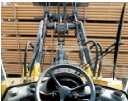
Det nya redskapsfästet och det vidareutvecklade TP Linkage ger utmärkt sikt vilket gör det ännu lättare att arbeta med till exempel pallgafflar.

När du sätter dig i den justerbara förarstolen, så upptäcker du snart varför Care Cab II erbjuder den bästa möjliga förarmiljön. På höger sida finns spakstället som är justerbart efter förarens önskemål. På själva spakstället finns fingertoppsmanövrerade pilotstyrda hydraulspakar som ger distinkt och lätt manövrering av lastaggregat och skopa, samt ett reglage för det unika automatiska växlingssystemet APS II**. Samtliga instrument är centralt placerade och lätt överskådliga på den nya instrumentpanelen. Den tredelade framrutan ger utmärkt sikt framåt och den nya, större bakrutan ger ännu bättre sikt bakåt än tidigare.