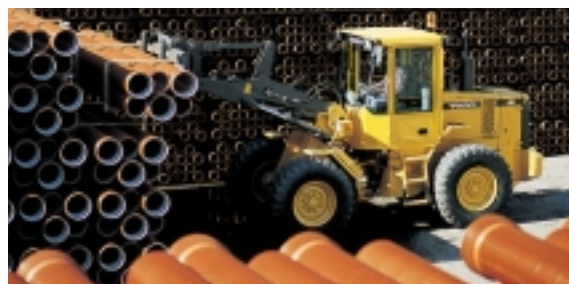
TP Linkage ger högt brytmoment och god parallellföring i hela lyftområdet.