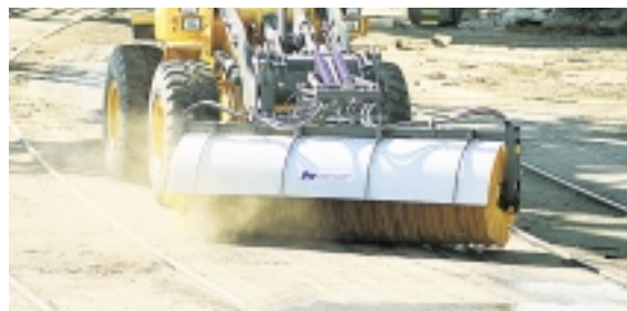
Tack vare den hydrostatiska transmissionen, med krypkörningsfunktion**, så kan L50D maximera effekten till redskapet under körning i mycket låga hastigheter.