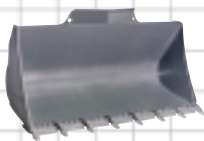
Standardskopa – tänder och segment

Volvos originalredskap är konstruerade och tillverkade för optimal anpassning till TP Linkage, vilket gör L50D och L70D mycket effektiva inom en mängd användningsområden.