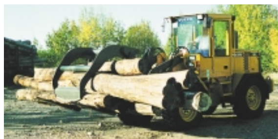
Med det breda redskapsutbudet är L50D och L70D verkliga allroundmaskiner.