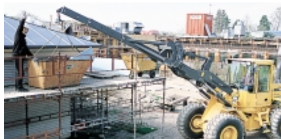
Volvos materialhanteringsarm är optimalt anpassad till det överlägsna brytmomentet och den exakta manövreringen som TP Linkage ger.