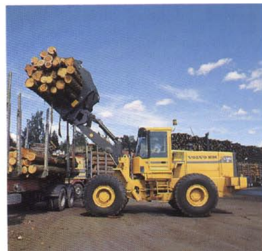
Det stora brytmomentet, räckvidden och lyfthöjden gör det lätt att hantera last även i tunga lägen.

Det nya, lastkännande styrsystemet ger exakt styrning, oavsett belastning, motorvarvtal och underlag. Systemet spar energi och gör hjullastaren lättmanövrerad också i svårkörd terräng.