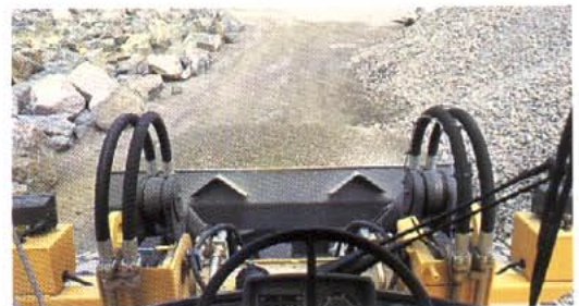
Den nya, välvda framrutan ger panoramasikt och ännu bättre överblick över skopan.

Som du märker gör Care Cab skäl för namnet.