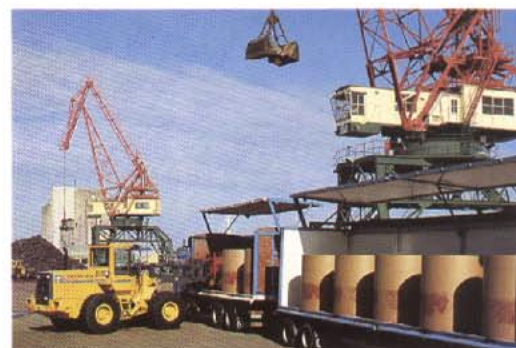
L90B är en lättmanövrerad materialhanterare för höga kapacitetskrav och tunga laster i hamnar och inom industrin.

Med dämpad lastarmsfjädring, Boom Suspension System, som extrautrustning går det att ta bort gungtendenserna vid hög fart oberoende av last. Det ökar arbetsförelmågan, körsäkerheten och komforten ytterligare.