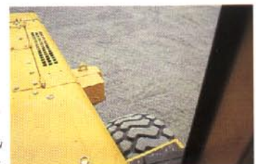
Föraren ser både motvikt och bak-hjul tack vare den goda bakåtsikten.